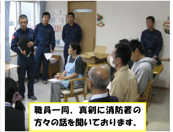
職員一同、真剣に消防署の方々の話を聞いております。