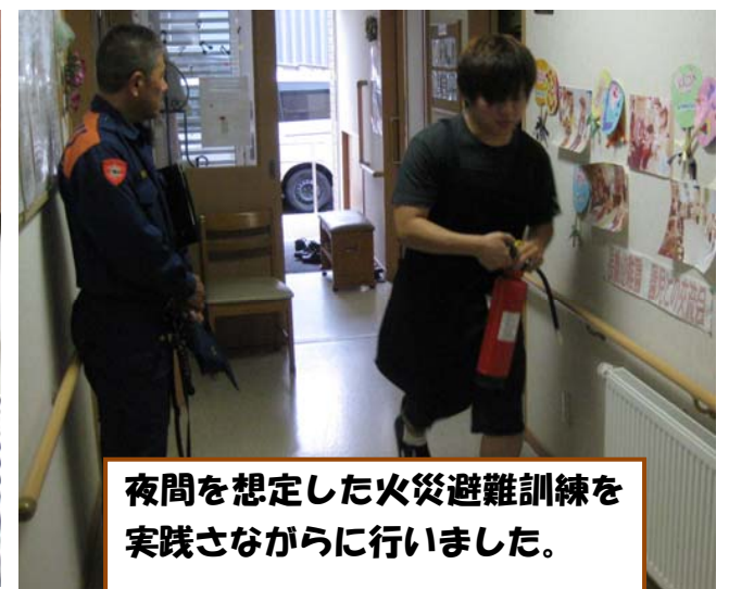
夜間を想定した火災避難訓練を実践しながら行いました。

10月18日、この日はホームの畑の後片づけを入居者の皆さんと行ないました。今年も色々な野菜や果物を植えてとても思い出に残る一年でした。これからは寒くなる日々が続く中々ホームの畑を見る機会が少なくなりますが、また来年も入居者の皆さんと一緒に色々な苗など植えていきたいと思っています。