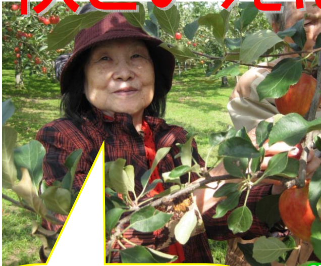
入居者の皆さん、とても林檎狩を楽しめた様子でした。