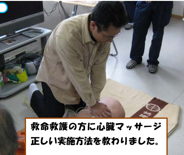
救命救護の方に心臓マッサージの正しい実施方法を教わりました。