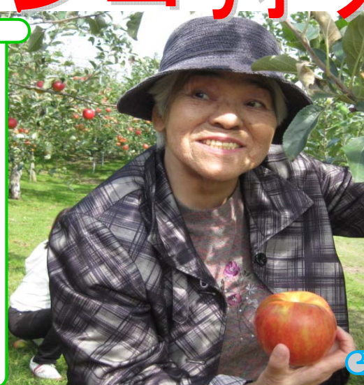
余市の夢さんと一年ぶり林檎狩りに行ってきました。