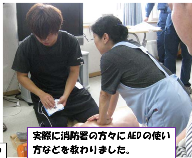
実際に消防署の方々にAEDの使い方などを教わりました。