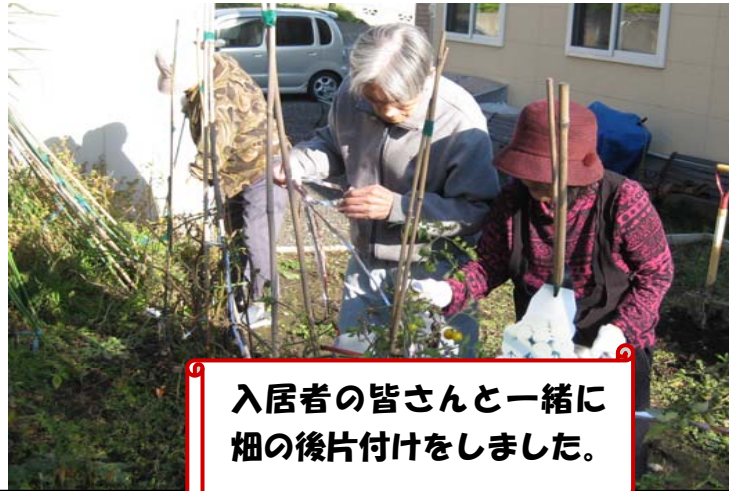
入居者の皆さんと一緒に畑の後片づけをしました。